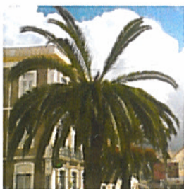
Figura 2 – Aspeto inicial de ataque de Rhynchophorus ferrugineus (Olivier)