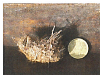
Figura 4 – Casulo de Rhynchophorus ferrugineus (Olivier)