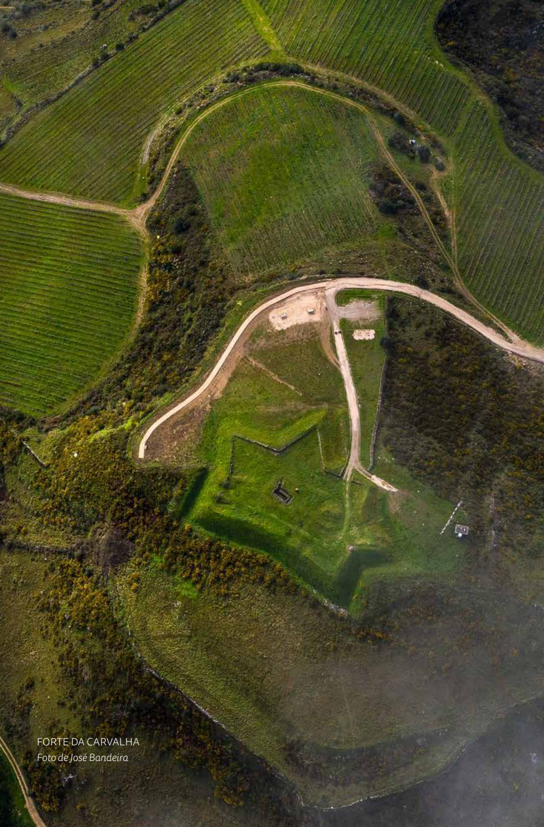
FORTE DA CARVALHA