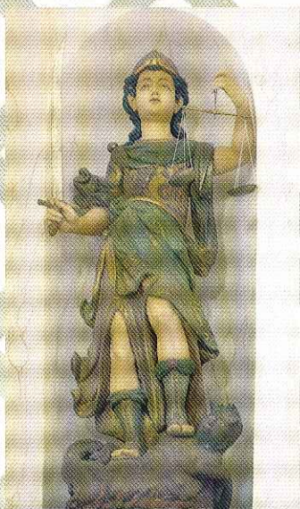
S. Miguel Arcanjo

A Igreja de S. Miguel, santo padroeiro da freguesia de Cardosas, situa-se num largo na parte sul da Vila.