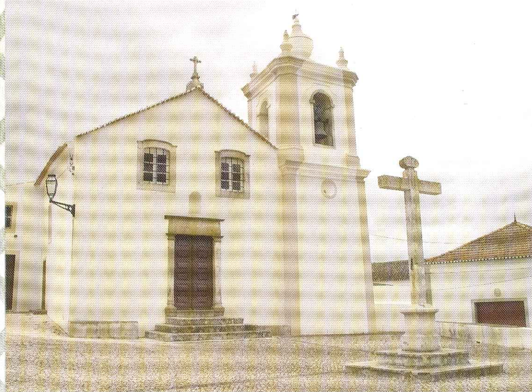
(Cruzeiro datado de 1724)