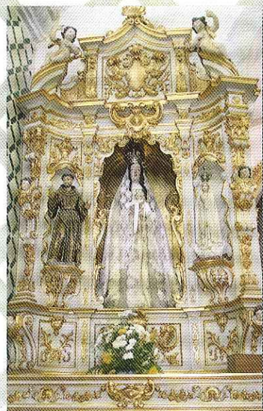
N. Sra. da Saúde S. Francisco de Assis · N. Sra. de Fátima