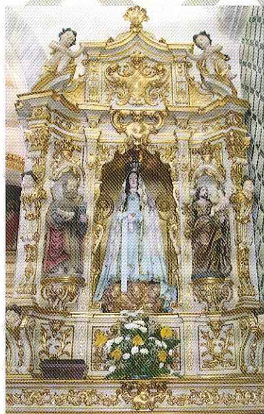
N. Sra. da Conceição S. Pedro · S. José