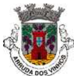
Quadro 1.3 - Caminhos Municipais no Concelho de Arruda dos Vinhos