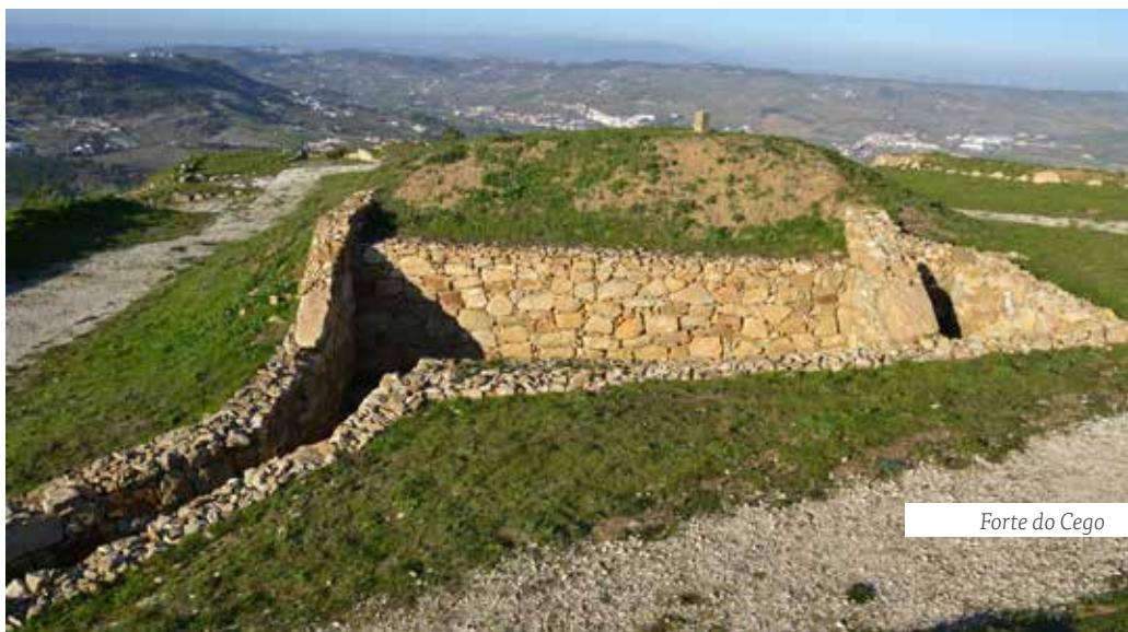
Forte do Cego

Daqui partimos em direção ao Forte do Cego , Obra Militar n.º 9 - Monumento Nacional, que integrou a 1.ª Linha Defensiva de Lisboa, aquando da 3.ª Invasão Francesa, em 1810. Em 1814 estava ainda artilhado com três peças de calibre 9, uma peça de calibre 12 e quatro canhoneiras, com uma capacidade para 280 soldados. Hoje em dia ainda se conhecem as canhoneiras e o paiol. Do Forte do Cego é possível ver a Serra de Montejunto e o complexo montanhoso de Aire e Candeeiros, perceptível em dias de céu limpo.