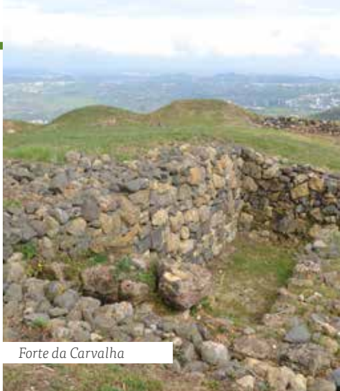
Forte da Carvalha

Seguimos até à Capela de Santa Ana , na localidade de Carvalha, e depois até ao Moinho Velho por trilhos em pedra. O percurso do Moinho Velho ao Moinho Eólico faz-nos acompanhar a evolução técnica no aproveitamento das energias renováveis. Descemos até ao lugar da Capelã e de seguida podemos vir a contemplar todo o Vale Encantado de Arruda dos Vinhos.