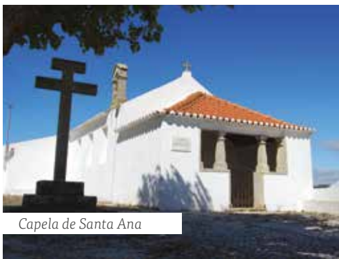
Capela de Santa Ana