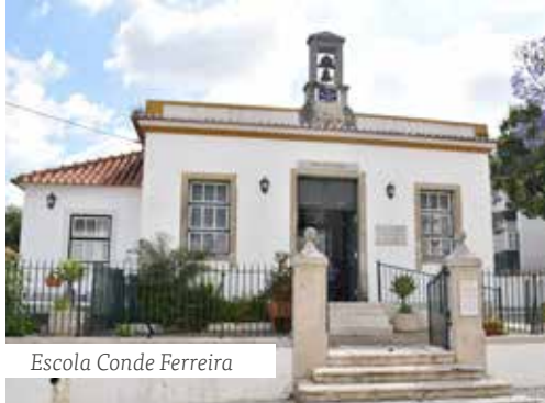
Escola Conde Ferreira

Termine o percurso no Centro Cultural do Morgado onde poderá visitar o Serviço Educativo e Cultural, o Posto de Turismo, o Centro de Interpretação das Linhas de Torres, a Galeria Municipal, a Oficina do Artesão e a Biblioteca Municipal Irene Lisboa.