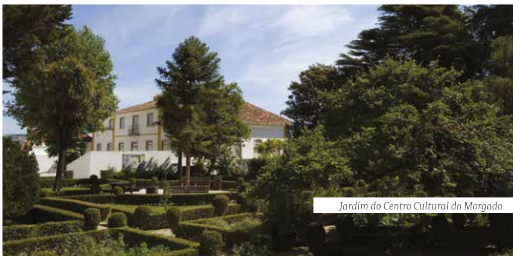
Jardim do Centro Cultural do Morgado